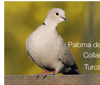
Paloma de Collar Turca