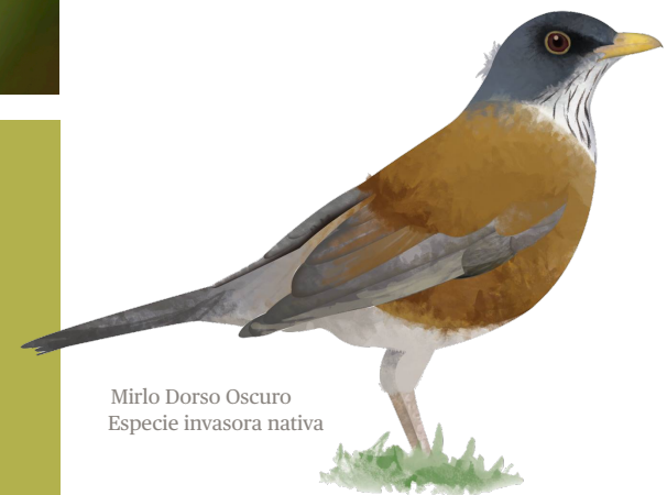
Mirlo Dorso Oscuro Especie invasora nativa

Todas están ampliamente distribuidas en el país, y son muy comunes en sitios con actividades humanas, como ciudades, campos de cultivo, y granjas ganaderas.