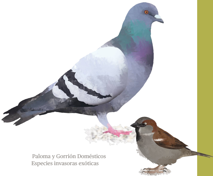
Paloma y Gorrión Domésticos Especies invasoras exóticas

Pueden afectar directamente el bienestar humano al causar importantes costos económicos por medio de generar pérdidas en cultivos, daños en edificios e infraestructura, y actuar como vectores de enfermedades.