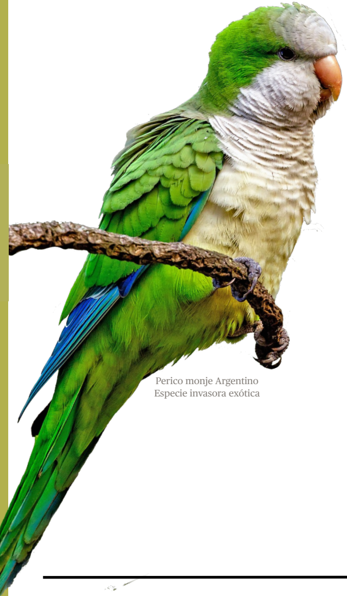
Perico monje Argentino Especie invasora exótica

Un nuevo componente de nuestra biodiversidad