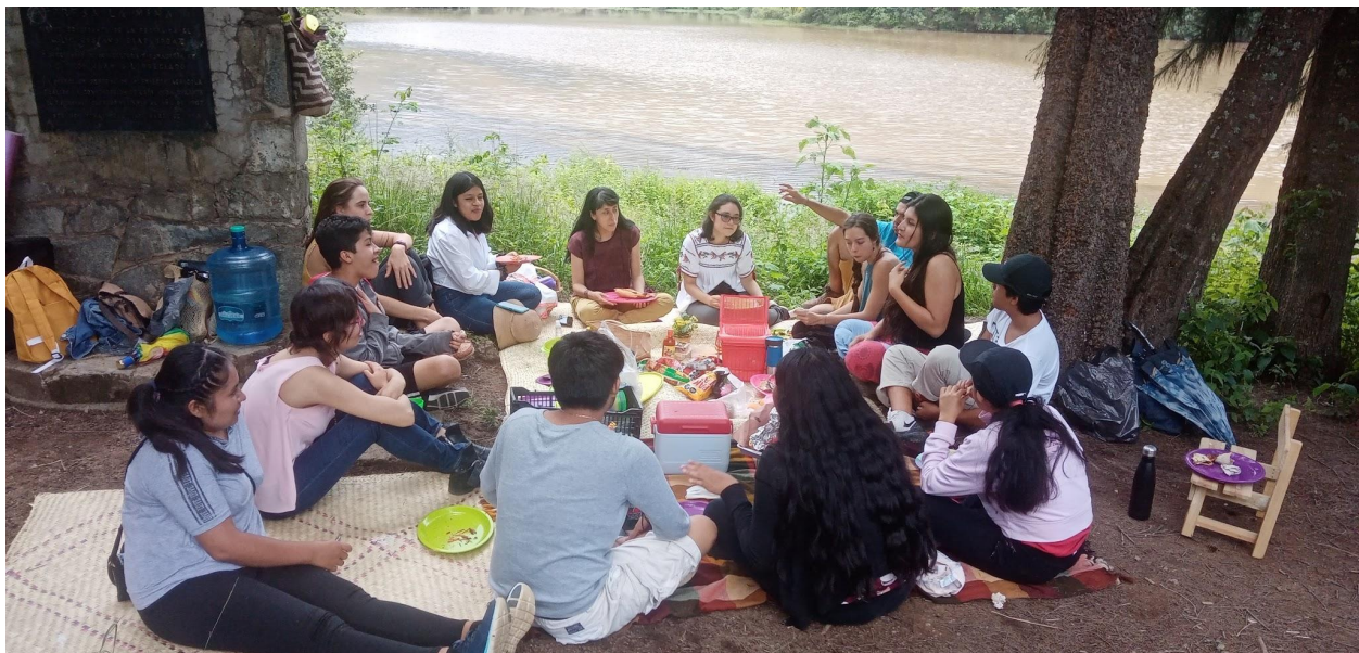
Espacio de intercambio, cronistas e investigadores. Sto. Domingo Tomaltepec.