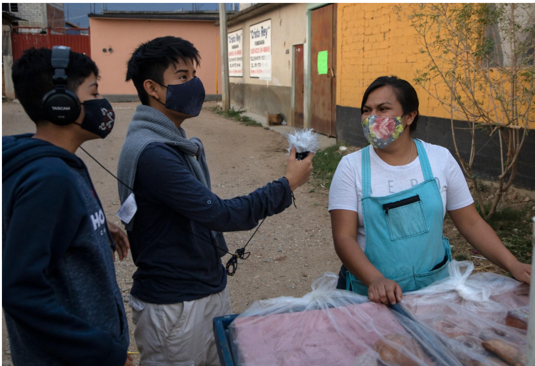
Cronistas comunitarios entrevistando a comerciante de la comunidad, Santo Domingo Tomaltepec.

A través de sus miradas, hemos podido comprender mejor las lógicas y las dinámicas de la comunidad, y establecer una colaboración activa que cuestiona y da cuenta del estado actual, los avances y posibilidades del sistema alimentario de Santo Domingo Tomaltepec.