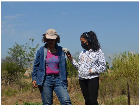
Entrevista en la parcela, Sto. Domingo Tomaltepec.

Una de las arenas más activas que el colectivo ha podido iniciar en Santo Domingo Tomaltepec, es la de creación de nuevas narrativas, desde la cual se ha establecido una relación y un espacio de intercambio entre jóvenes de la comunidad e integrantes del proyecto, dando lugar a la conformación del grupo de cronistas comunitarios .