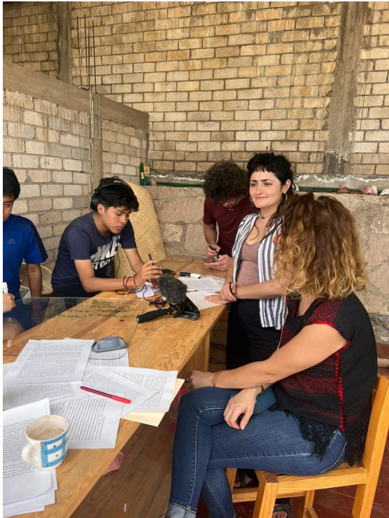
Reunión de planeación para la elaboración de un guión.

La Caminata Sonora fue un evento público y performativo; un recorrido sonoro, inmersivo y participativo con los miembros de la comunidad de Santo Domingo Tomaltepec e invitados de comunidades aledañas. Una caminata que tocó el presente, pasado, y futuro del territorio, y el manejo de los recursos naturales, principalmente el agua y la memoria biocultural.