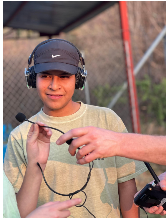
Prueba de equipo y sonido para la Caminata Sonora con los Cronistas Comunitarios.

Como parte de las sesiones de trabajo, se desarrollaron dos sesiones de introducción a la edición de audio con el uso de una plataforma software de libre acceso (Audacity). Con la intención de que a la larga las y los Cronistas Comunitarios puedan tener más libertad en la edición y