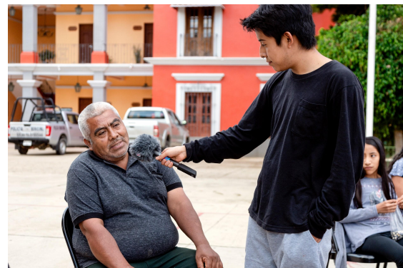
Radio Móvil durante la Feria de Semillas.

Con acciones como éstas esperamos que el grupo de jóvenes obtenga más herramientas que les ayuden a formular y enriquecer narrativas comunitarias que partan desde sus sentipensares. Que sigan conectando e intercambiando a través de generaciones, y que nos sigan contagiando con su entusiasmo por la historia y la memoria biocultural de su comunidad.