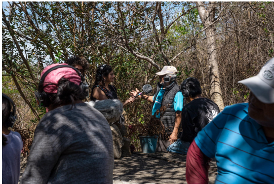
Caminata Sonora por el territorio de Santo Domingo Tomaltepec.

A la caminata asistieron alrededor de 30 personas de diferentes edades de la comunidad de Santo Domingo Tomaltepec y comunidades aledañas. Durante la caminata las y los jóvenes Cronistas asistieron en la presentación y ejecución de la actividad, también en el manejo del equipo y en la puesta en escena de una radionovela.