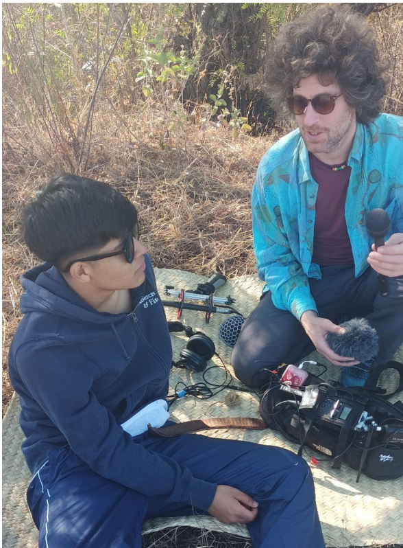
Prueba de equipo.

Se trabajó también en el uso y manejo de equipo de audio diverso, como micrófonos inalámbricos, transmisores de bluetooth, y audífonos inalámbricos, con los que no sé había trabajado antes, y los cuales abren nuevas posibilidades técnicas para la presentación e implementación de dinámicas y acciones alrededor de las narrativas comunitarias.