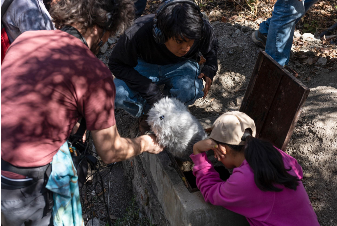
Puesta durante escena Caminata Sonora