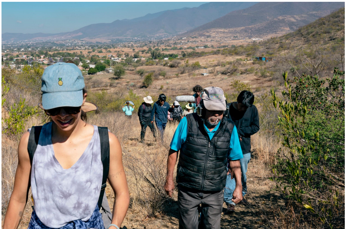
Reconociendo el territorio. Caminata Sonora