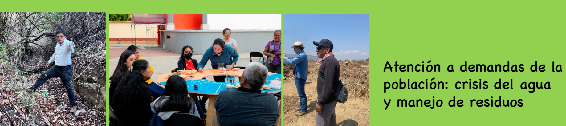
Atención a demandas de la población: crisis del agua y manejo de residuos