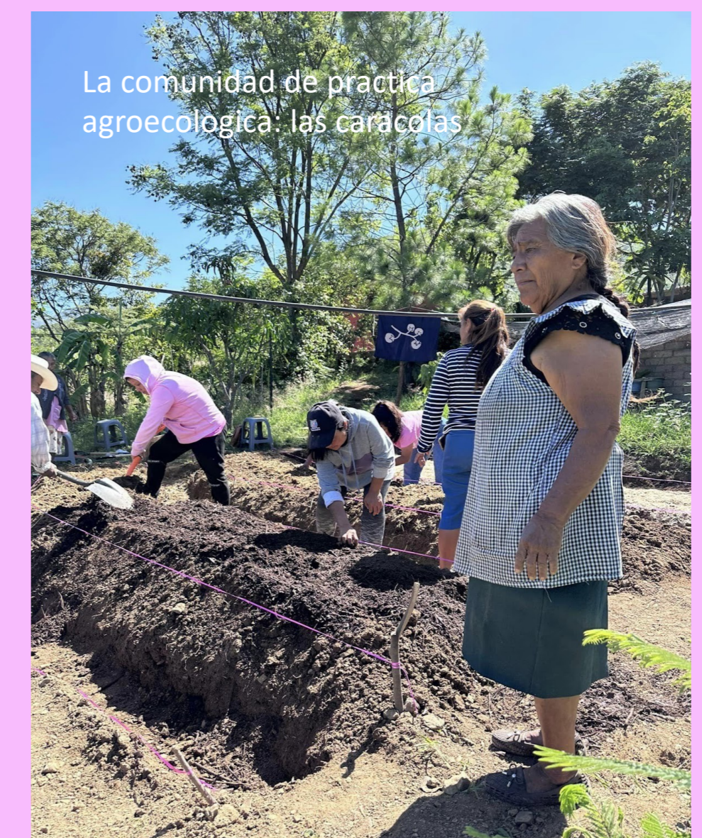
La comunidad de práctica agroecológica: las caracaras